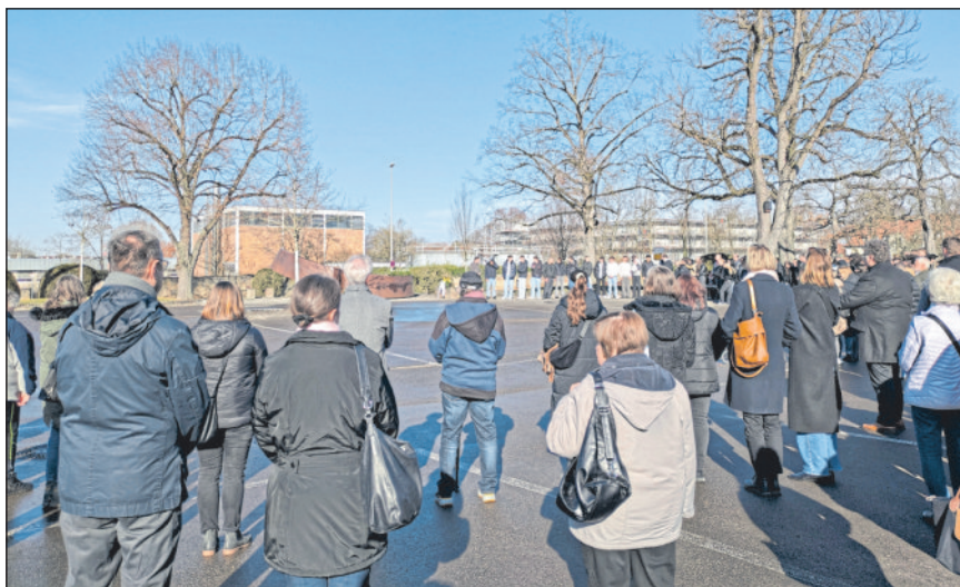
Erneut kamen zahlreiche Menschen zusammen, um an die Opfer des Amoklaufs von Winnenden und Wendlingen zu erinnern.