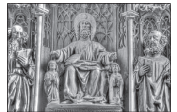
Die Schloßkirche St. Jakobus ist an Sonn- und Feiertagen von 14.00 bis 16.00 Uhr zu Besichtigung und Stille geöffnet.