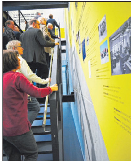
Die Gründung und Weiterentwicklung des Unternehmens entlang des Zeitstrahls.