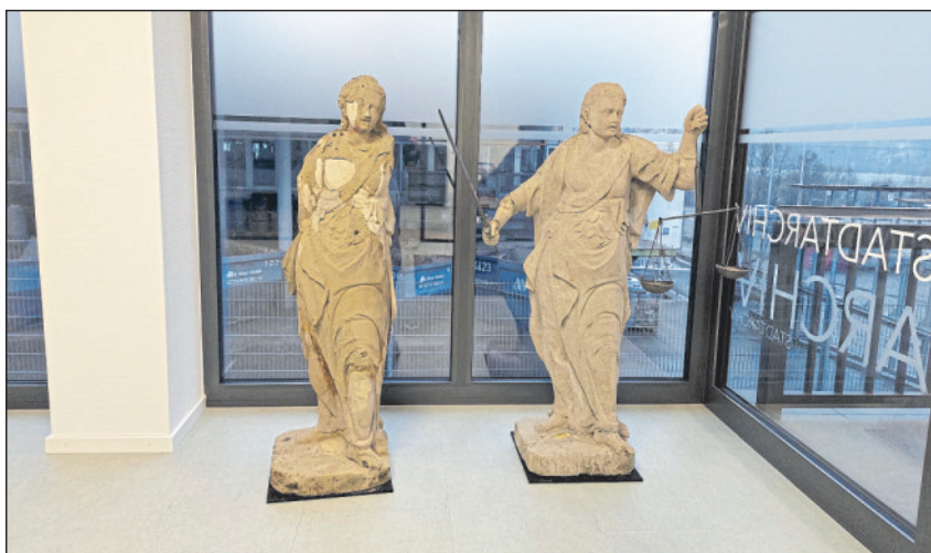
Justitia-Figuren im Eingangsbereich des Stadtarchivs.

20.09.2023: Unter dem Motto „Vor 60 Jahren - AEG Elektrowerkzeuge kommt nach Winnenden“ stand eine Kooperationsveranstaltung von Stadt und Initiative Stadtmuseum im Storchkeller der