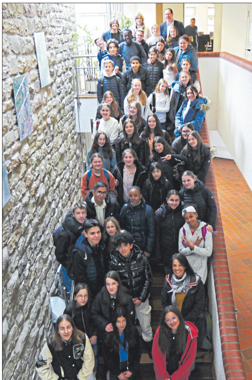
Die französische Gruppe wurde von den deutschen Lehrkräften zum Empfang im Rathaus begleitet.

Die echten Mitarbeitenden stehen Ihnen für Rückfragen und zur Überprüfung jeglicher Anliegen gerne zur Verfügung.