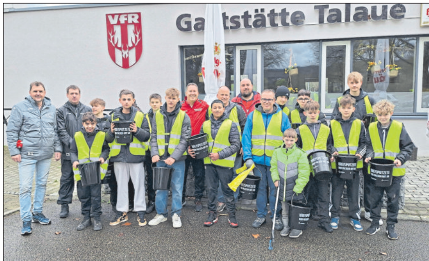
Auch die Fußball C-Jugend der SGM Winnenden mitsamt den Trainern war am Samstag unterwegs.