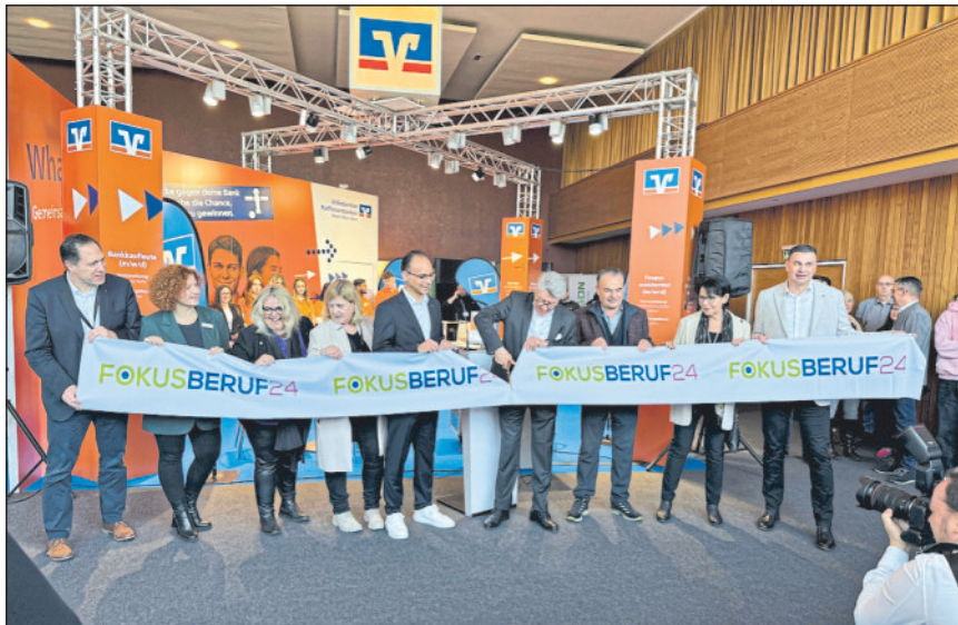
Eröffnung der Fokus Beruf 2024 in Winnenden.

Zahlreiche Schulklassen, Eltern und weitere Interessierte besuchten die bekannte kreisweite Messe für Ausbildung und Studium, welche in diesem Jahr erstmals in Winnenden stattfand.