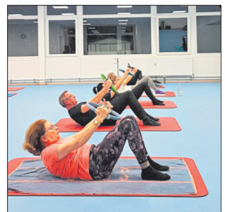
Pilates-Kurs im „VHS Aktiv“.

Info: In der Kornbeckstraße 4 starten immer wieder neue Kurse. Alle Angebote findet man auf der Internetseite www.vhs-winnenden.de .