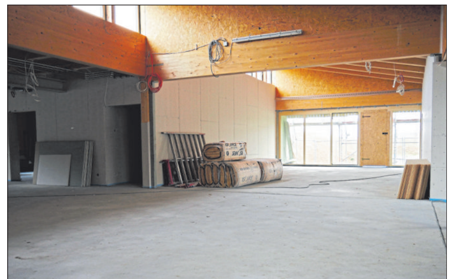
Die Arbeiten an der neuen Kita Koppesbach liegen optimal im Zeitplan.

In unmittelbarer Nähe zum neuen Standort der Mehlbeere nimmt die neue Kita Koppesbach weiter Gestalt an. Im Anschluss an die Pflanzaktion bot Roland Bornemann, Amtsleiter für Hochbau und Gebäudemanagement, Interessierten die Möglichkeit, den aktuellen Stand der Arbeiten selbst zu begutachten. Mit großem Interesse erkundigten sich die Besucherinnen und Besucher über die neuen Räumlichkeiten. Sowohl die Fassade wie auch die Innenräume lassen bereits gut erahnen, wie die Kita nach der Fertigstellung aussehen wird. Im September 2024 wird die Kita wie geplant fertiggestellt werden.