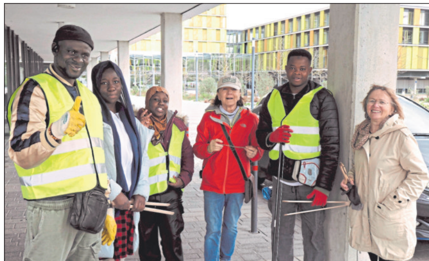
Jede helfende Hand war willkommen.