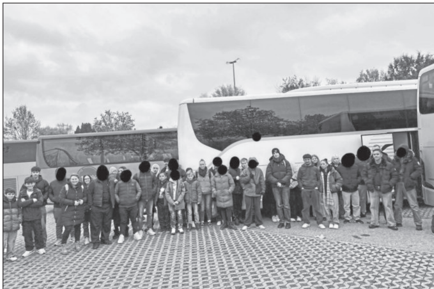
Ausflug in den Europapark

Deshalb bedankt sich die Mobile Jugendarbeit und die Mobile Kindersozialarbeit Winnenden ganz herzlich bei allen, die diesen wundervollen Ausflug ermöglicht haben. Ein besonderer Dank geht dabei an die Bürgerstiftung Winnenden, welche uns die Fahrt zum Europapark mit einem großen Reisebus ermöglicht hat.