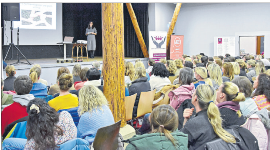
Vortrag in der Alten Kelter.