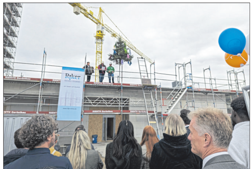
Richtspruch durch die Erich Schief GmbH & Co. KG.

Riker Wohnbau, die Stadtverwaltung und Rommel + Wagenpfeil Architekten luden zum Richtfest auf der Baustelle im Douglasienweg ein. Bei einer Begehung der Baustelle konnten die Gäste den Fortschritt des Baus in seinen unterschiedlichen Stadien wie im Zeitraffer erleben. Im Schlüsselfertig-Prinzip bauen Riker Wohnbau und Rommel + Wagenpfeil Architekten 50 Wohnungen und eine viergruppige Kindertageseinrichtung im Auftrag der Stadt Winnenden. Die Wohnungen werden später überwiegend Einzelpersonen und Familien mit geringen Einkommen ein Zuhause bieten. Mit dem Richtfest am 22. Oktober konnte nun ein bedeutender Meilenstein gefeiert werden.