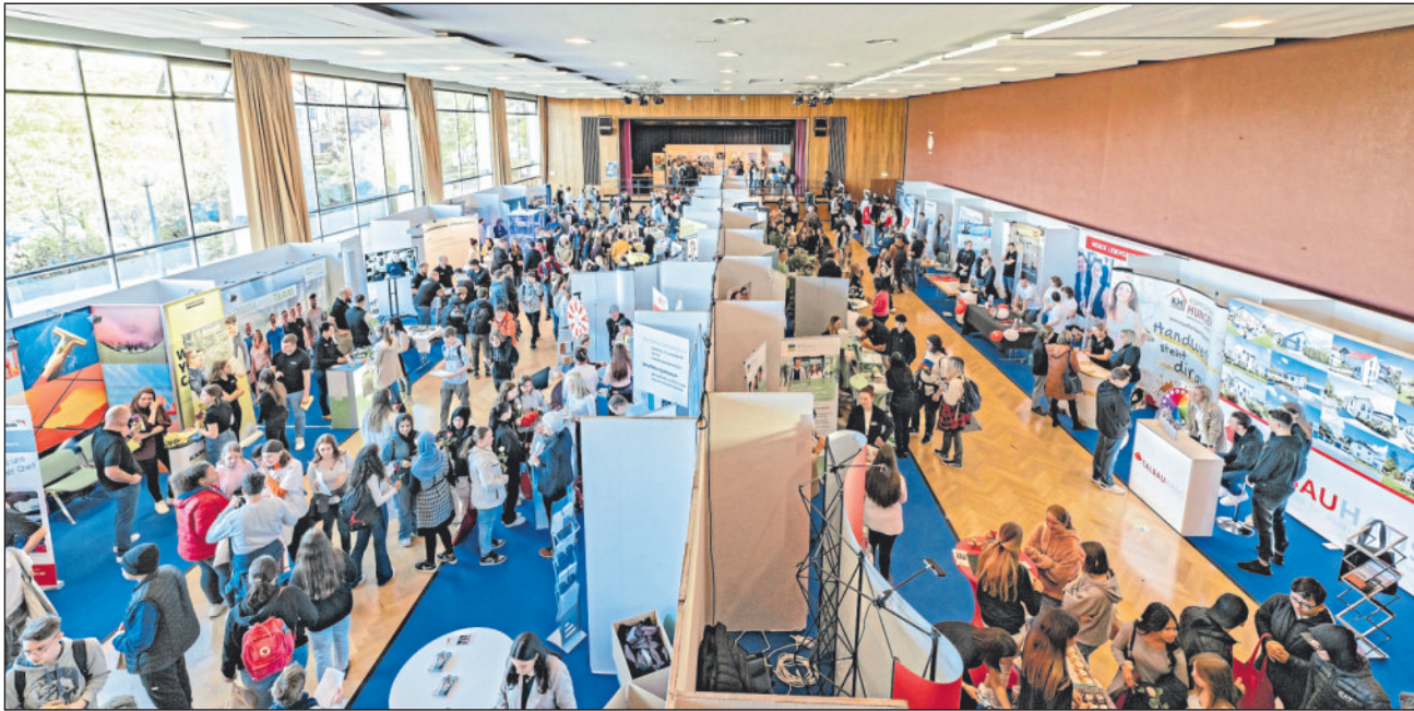
Blick von oben auf „Abenteuer Wirtschaft“ 2022.