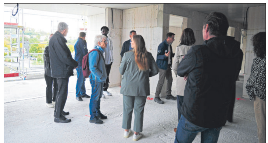
Besichtigung der Baustelle im 7. OG.

Bei der anschließenden Besichtigung der Baustelle konnten die Besucherinnen und Besucher deutlich erkennen, wie weit fortgeschritten die Arbeiten in den einzelnen Bereichen bereits sind. Mit dem Aufzug in das 7. Obergeschoss startete die Begehung in kleinen Gruppen. Wo im obersten Stock noch die Fenster fehlten, waren diese ein Stockerker darunter bereits eingesetzt. Auf dem Weg in Richtung Erdgeschoss kamen schrittweise auch Zwischenwände, Wasser- und Stromleitungen und schlussendlich Wandverkleidungen hinzu. Eine fertiggestellte und bereits möblierte Wohnung als Anschauungsobjekt bildete den Abschluss der Begehung.