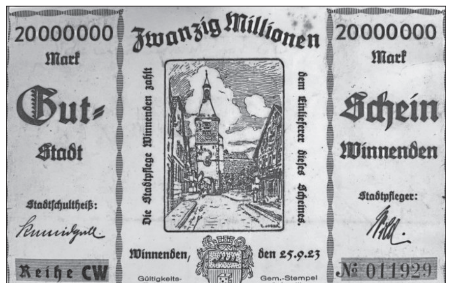
Leihgabe von Werner Heincke: Winnender Notgeld aus dem Inflationsjahr 1923