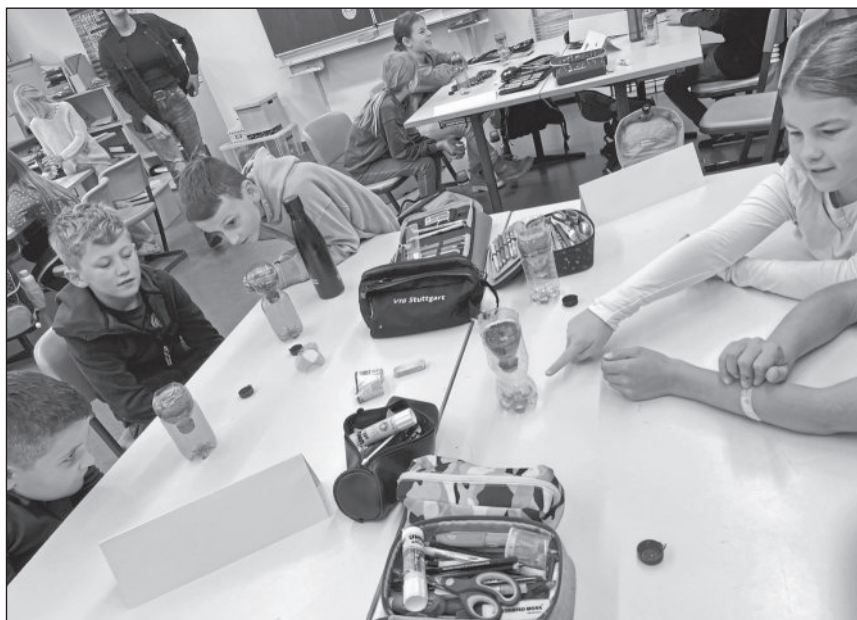
Schüler der Klasse 3/4 der Grundschule Breuningsweiler experimentieren mit Wasser.