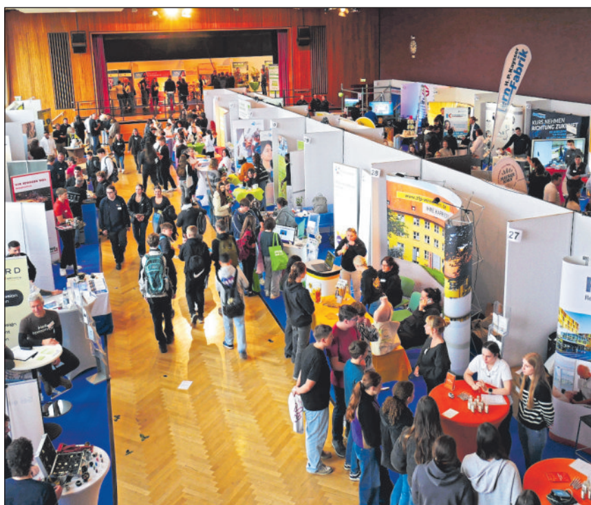
43 Unternehmen präsentieren ihre Ausbildungs- und Studienangebote.

Sowohl die Organisatoren als auch die Unternehmen waren mit dem Verlauf der Messe überaus zufrieden. Die hohen Besucherzahlen haben zu zahlreichen vielversprechenden Gesprächen zwischen den Unternehmen und potenziellen Auszubildenden geführt.