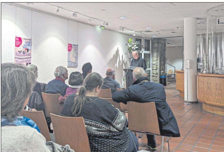
Ausstellungseröffnung mit Dr. Stefan Wolle, Wissenschaftlicher Leiter am DDR Museum, Berlin.

Seit dem 7. November können Besucherinnen und Besucher des Rathauses im Foyer die Ausstellung „Friedliche Revolution und deutsche Einheit kompakt“ der Bundesstiftung Aufarbeitung erleben. Nach einer kurzen Begrüßung durch