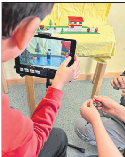
In der Trickfilmwoche beim Talentcampus haben die Kinder Filme in Stop-Motion-Technik gedreht.