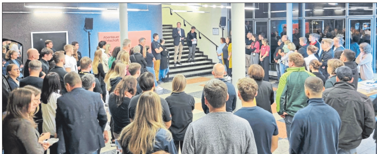
Eröffnung der Ausbildungsmesse durch Oberbürgermeister Hartmut Holzwarth.

Über 1.200 Besucherinnen und Besucher informierten sich an den Messeständen über Ausbildungs- und Studiemöglichkeiten