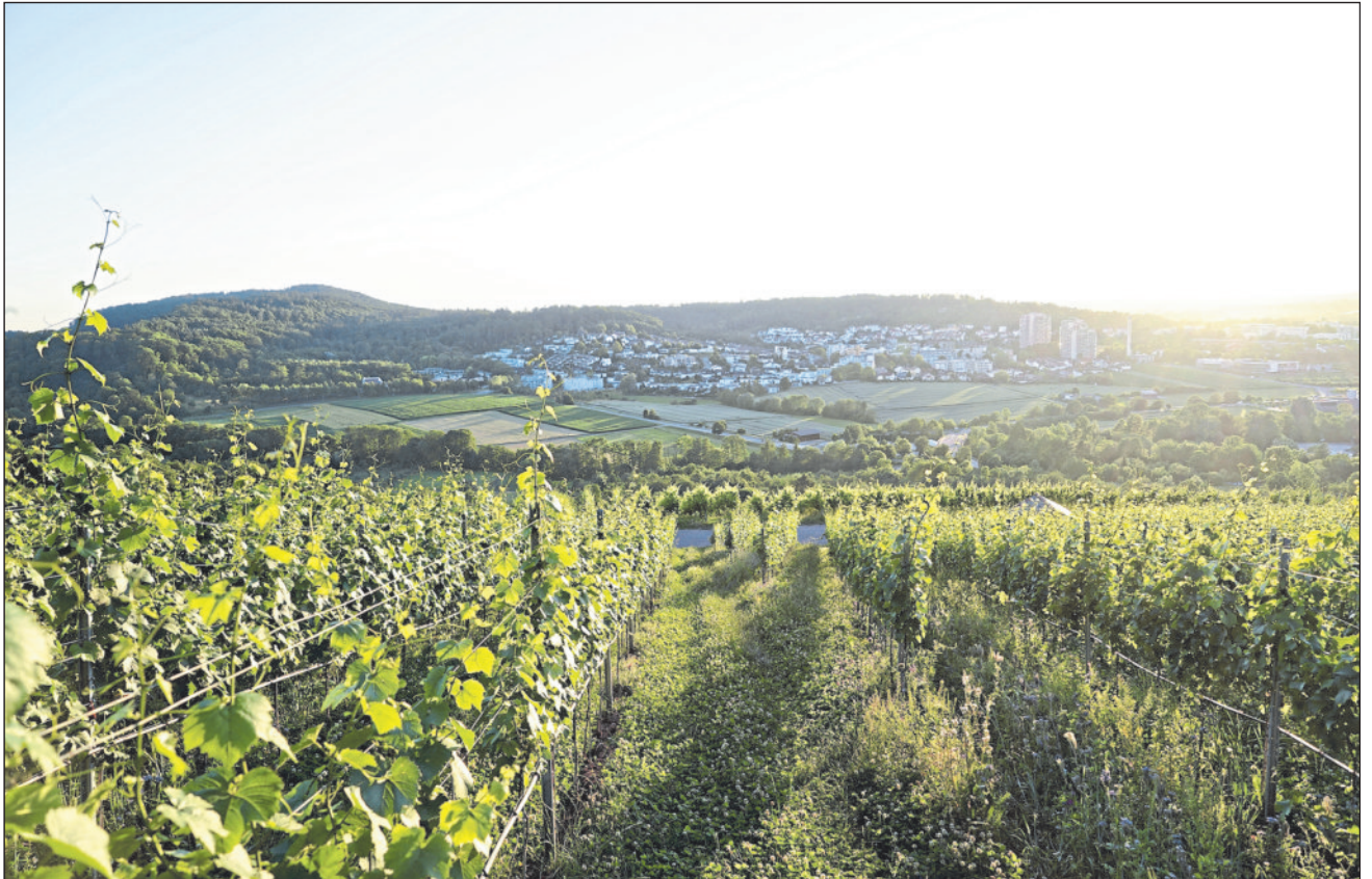
Ausblick auf Winnenden.

Das wie im Vorjahr zwischen dem Roßberg und dem Haselstein angesiedelte Festgelände bietet den Besucherinnen und Besuchern die Gelegenheit, gemütlich zwischen den Ständen der Weingüter und Gastronomen zu flanieren. Bei einem guten Glas Wein lässt sich die herrliche Aussicht über Winnenden ent-